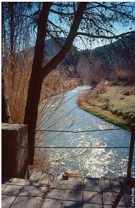
El río Turia desde el Puente Marqués, Aras de los Olmos

entidad promotora: Ayto. de Aras de los Olmos